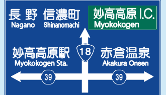
豊橋の交差点標識

カーナビで、「二俣」「豊橋」などから誘導されますが、「豊橋」の交差点で右折してお越し下さい。